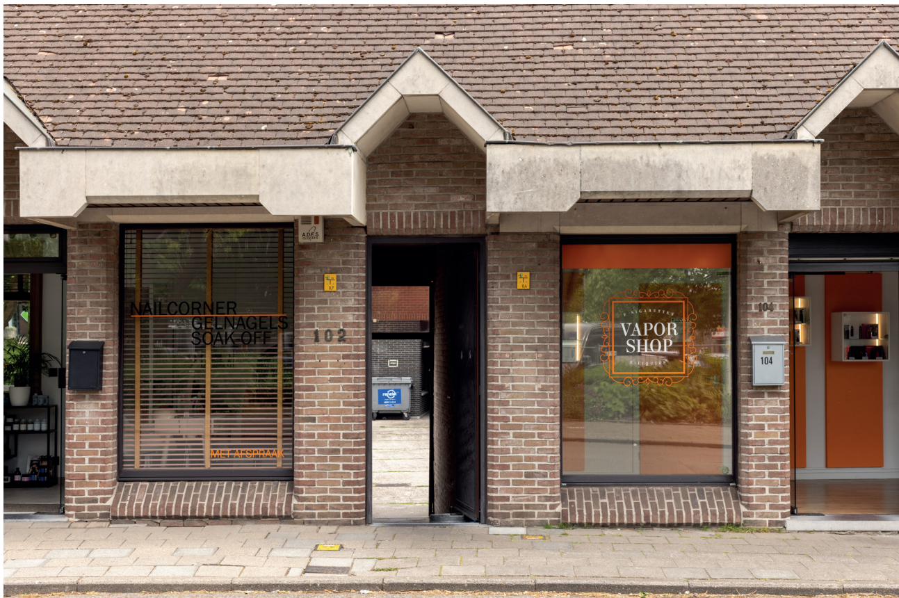
Doorsteek voor voetgangers vanaf Hendrik Heymanplein