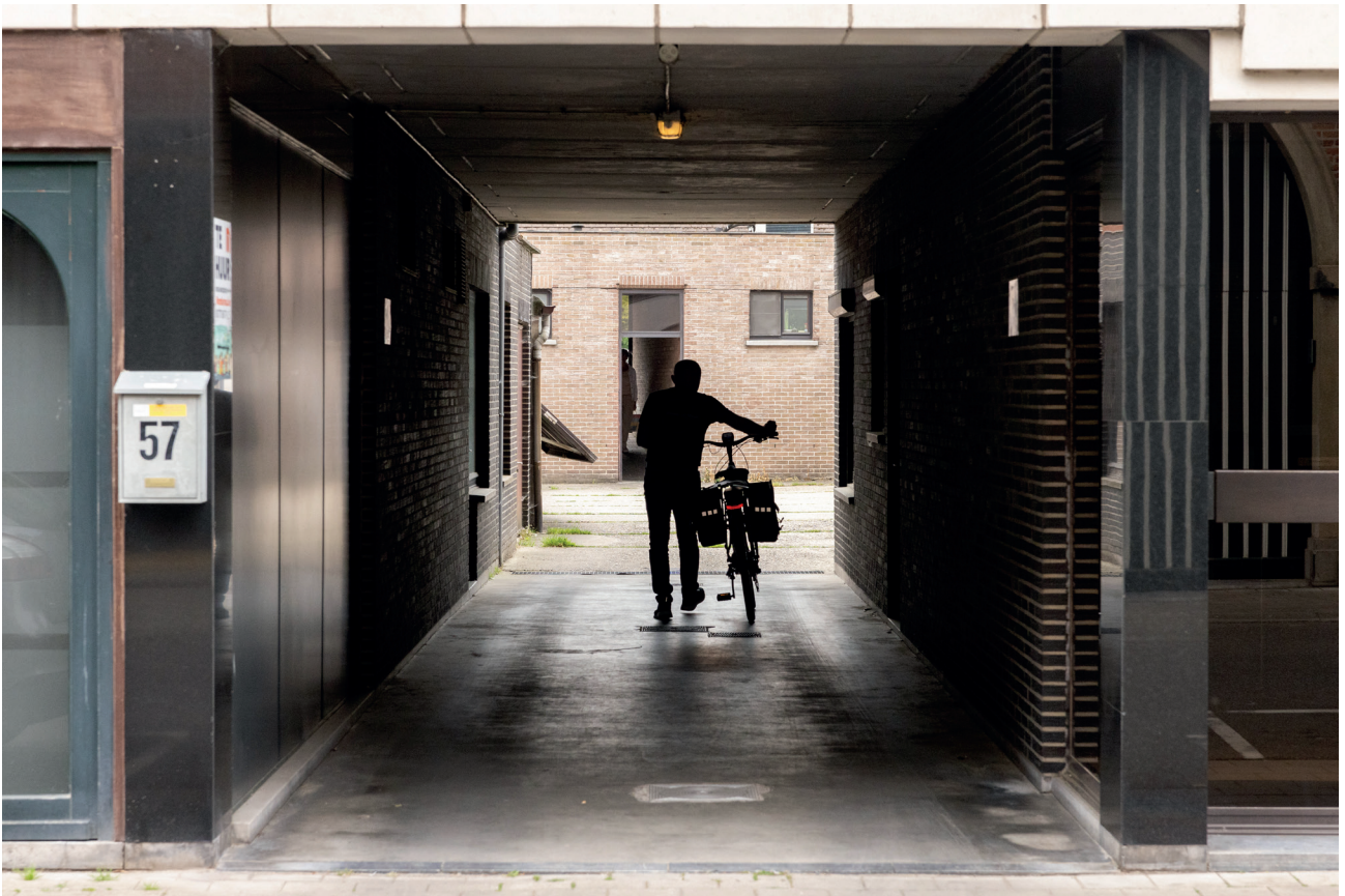
Doorsteek voor voetgangers vanaf Kokkelbeekstraat