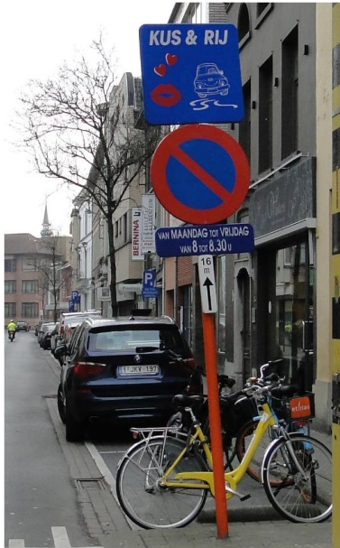
Figuur 2: Kus&Rij-zone voor de school