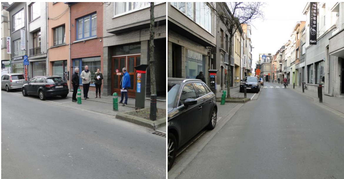
Figuur 3: Ankerstraat ter hoogte van de 'groene poort' voor fietsers