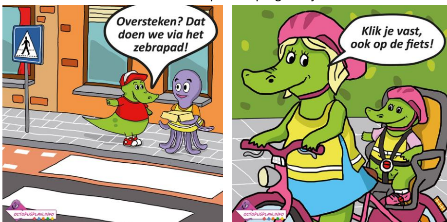
Figuur 4: 2 Octopusstoeptegels