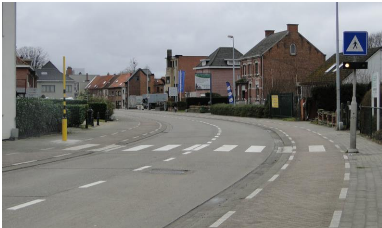
Figuur 3: De directe schoolomgeving met het zebrapad voor de schooluitgang