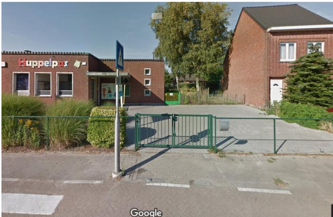
Figuur 2: Parkeergelegenheid leerkrachten op het schooldomein