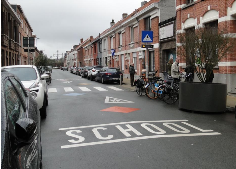
Figuur 6: Octopusthermoplasten in de Oude Molenstraat 58-60