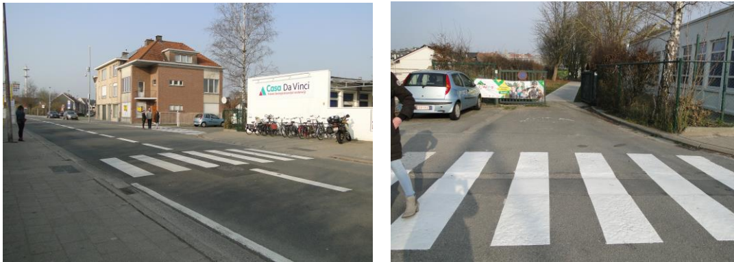
Figuur 5: Schooltoegang thv Noordlaan

Schooltoegang Noordlaan: Deze uitgang is gelegen aan de achterzijde van het station van Sint-Niklaas met een zeer uitgebreide fietsenstalling en een halte van De Lijn voor verschillende buslijnen.