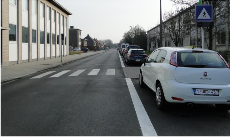
Figuur 4: Zebrapad ter hoogte van de schoolpoort