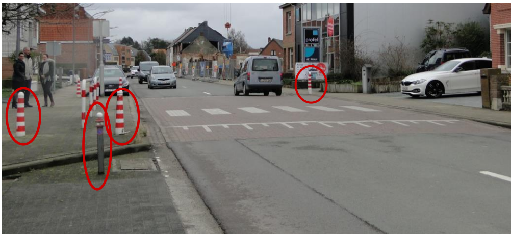
Figuur 7: Weg te nemen paaltjes thv schooluitgang Wijkafdeling Sint-Camillus -