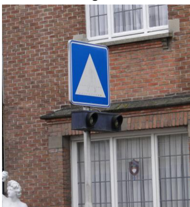
Figuur 8: Bi flash ter hoogte van de oversteekplaats aan de school