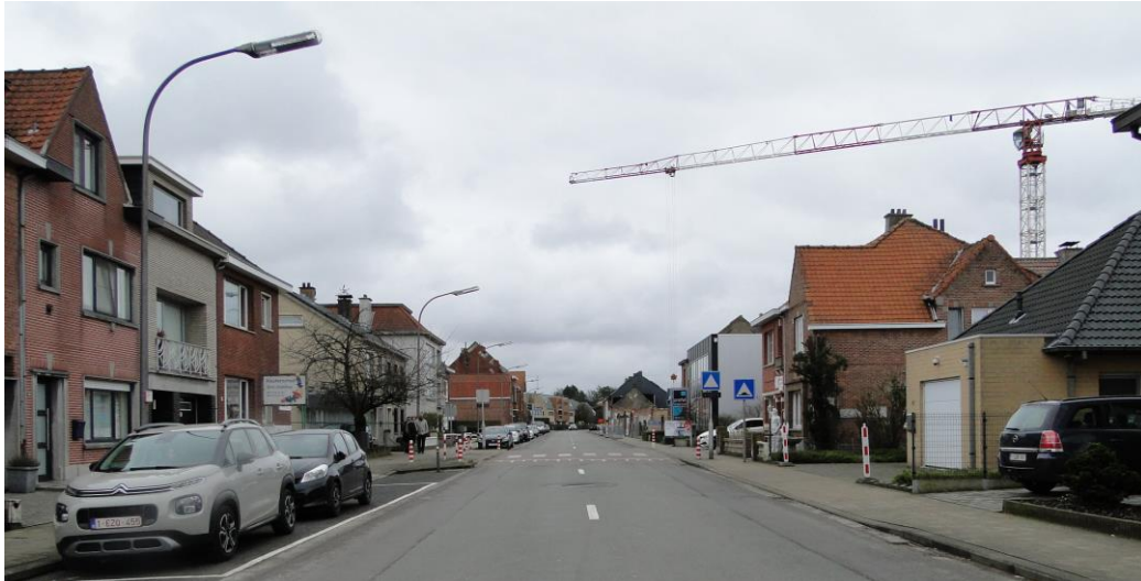
Figuur 6: Wegbeeld Hertjen

De stad Sint-Niklaas plant het afbakenen van de schoolzone met Octopusthermoplasten in augustus 2019.