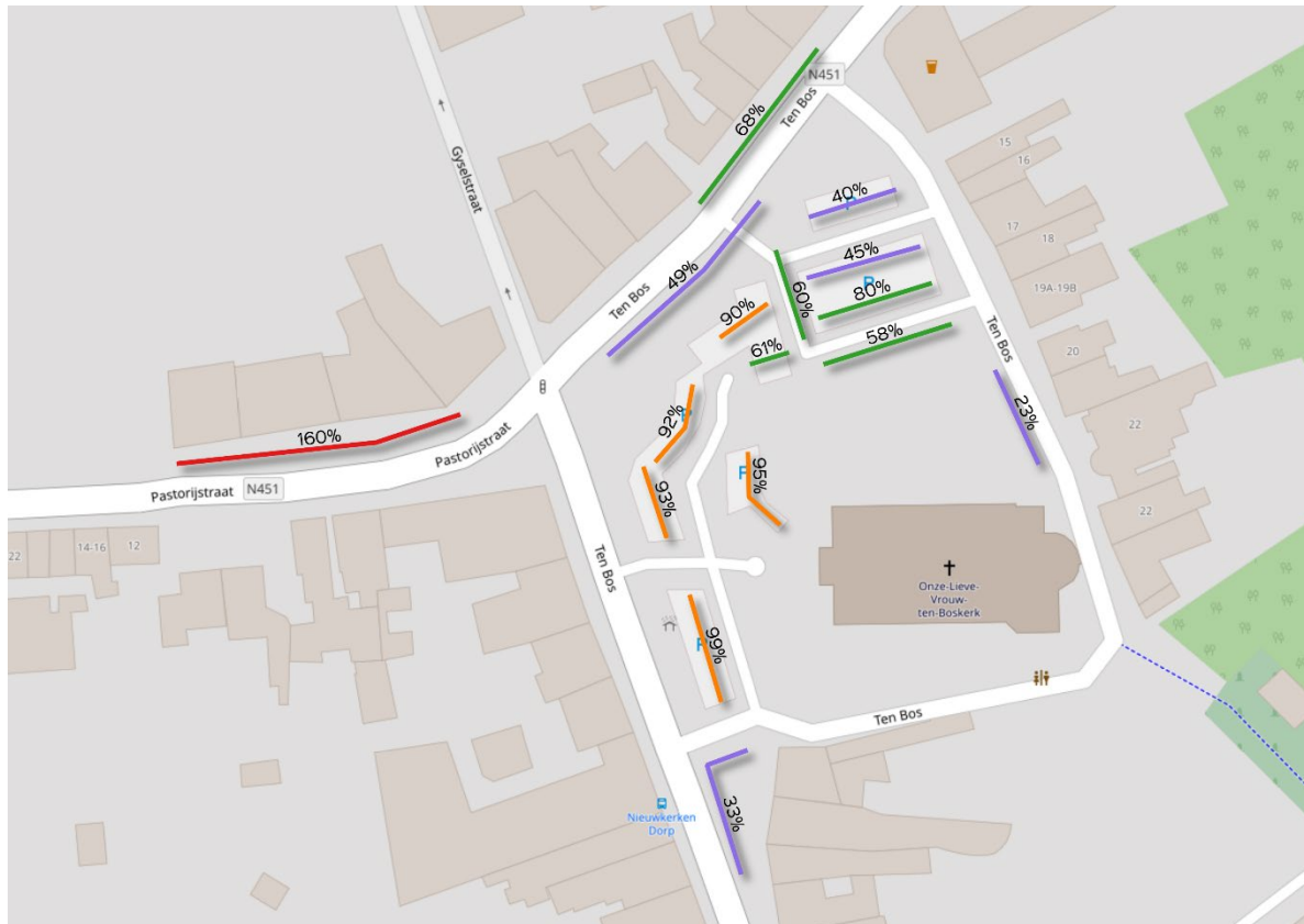
Figuur 3: Gemiddelde parkeerbezetting 's avonds (17u – 18u)