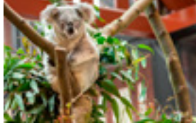
Zoo 7,50 EUR