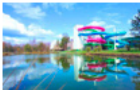
Vakantiepark Molen- heide - 178 EUR/midweek