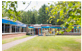
JHB De Roerdomp (Bokrijk) 43 EUR