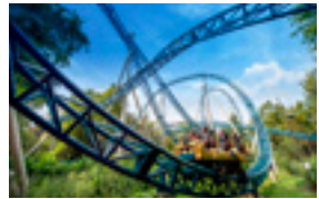
C-mine 3 EUR