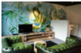
Upstairs hotel 56 EUR/nacht