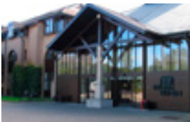
Zorgverblijf Ter Duinen 36 EUR/nacht