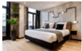
KaBa Hostel 19 EUR