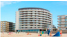
Vayamundo Oostende Appartement vanaf 78 EUR/nacht