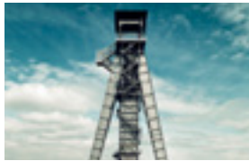
Plopsaland De Panne - 25,90 EUR