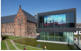
STAM 1,60 EUR